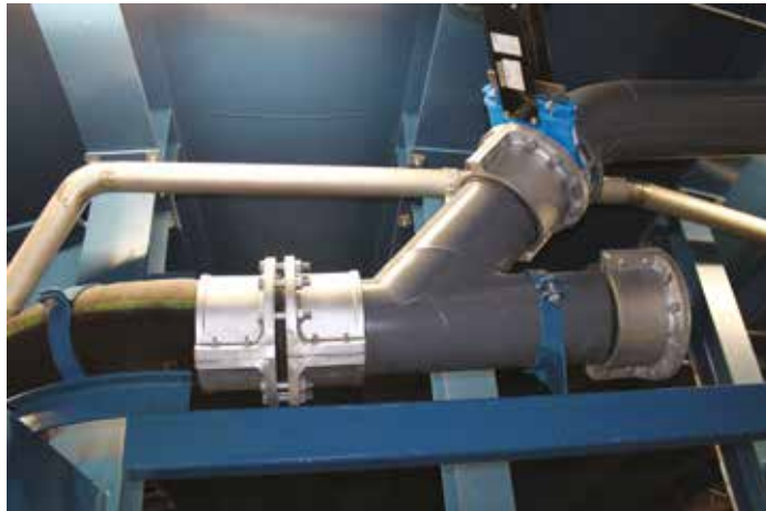
Bombas horizontais para polpa