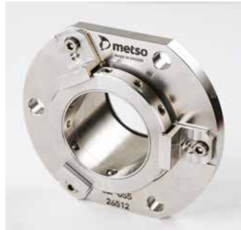
Selagem Enviroset™ e Expeller™