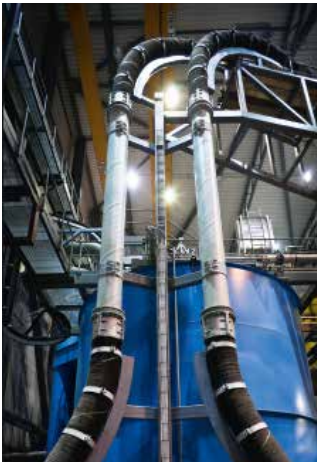
Bombas verticais para polpa

Mangotes e tubulações revestidas Mangotes e tubulações revestidas